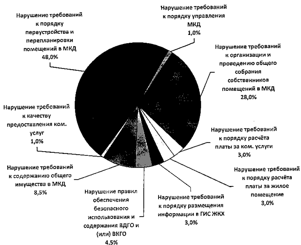
Рисунок 1. Статистика выявленных нарушений

Статистика выявленных нарушений в процентном соотношении наглядно представлена на рисунке 1.